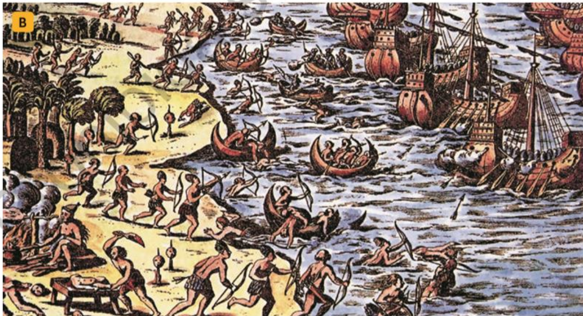
Anónimo. Indígenas caribes y llegada de los españoles a sus tierras. [Pintura].

Recuerda guardar el trabajo de tus guías en tu cuaderno o archivarlas, pues nos serán muy útiles cuando nos volvamos a ver. No es necesario que me las envíes por correo. Espero que nos volvamos a ver pronto. Saludos!