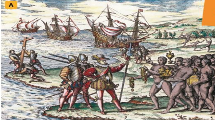
De Bry, Theodor (1594). Desembarco de Colón en Guanahani . [Grabado].

¿Qué características tuvo el proceso de conquista en América?