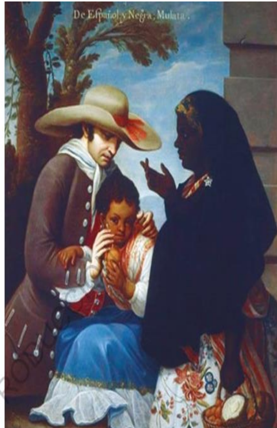
A Cabrera, Miguel (c. 1736). De español y negra, mulata . [Pintura].

¿Qué características físicas, culturales y sociales poseía cada grupo colonial? ¿Cómo estas características determinaban su posición social?