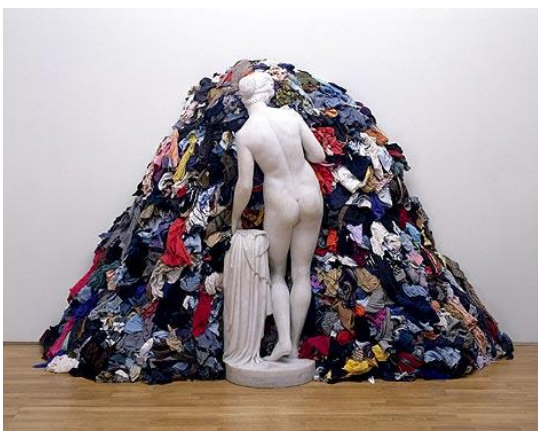
Pistoletto. La Venus de los trapos, 1967

Ilya Kabakov distinguió tres tipos de instalaciones: las pequeñas (tipo repisas), las adosadas a la pared cubriendo parte del suelo, y las totales, que utilizan el espacio de manera completa. Las salas de entrada o espacios previos dan significación a estas obras: si se encuentran en medio del museo, se producirá un contraste absoluto, quizá, entre un espacio puede que lujoso y una instalación pobre; estos choques estéticos son deliberadamente buscados por el artista.