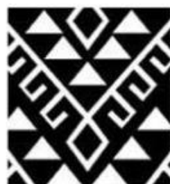
KULPUWE NĪMIN SERPIENTE ANTIGUA