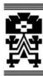
LUKUTUWE PRIMER HUMANO