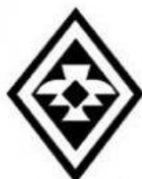
ANUMKA PLANTA MEDICINA