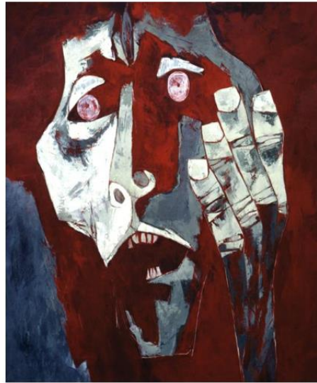
"Cabeza de Napalm" Oswaldo Guayasamín