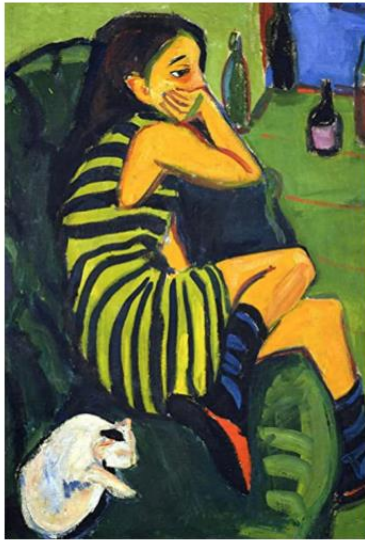
"Artista Marzella" Ernst Ludwig Kirchner