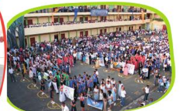
Aniversario de un colegio.