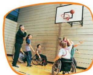
Estudiantes practicando básquetbol.

El colegio es el lugar donde pasas la mayor parte del día. Durante la jornada participas de distintas maneras en la comunidad escolar, por ejemplo, en el consejo de curso, al ordenar la sala, al repartir útiles, al responder una pregunta y al jugar con tus amigos y amigas.