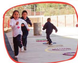
Clase de Educación física.